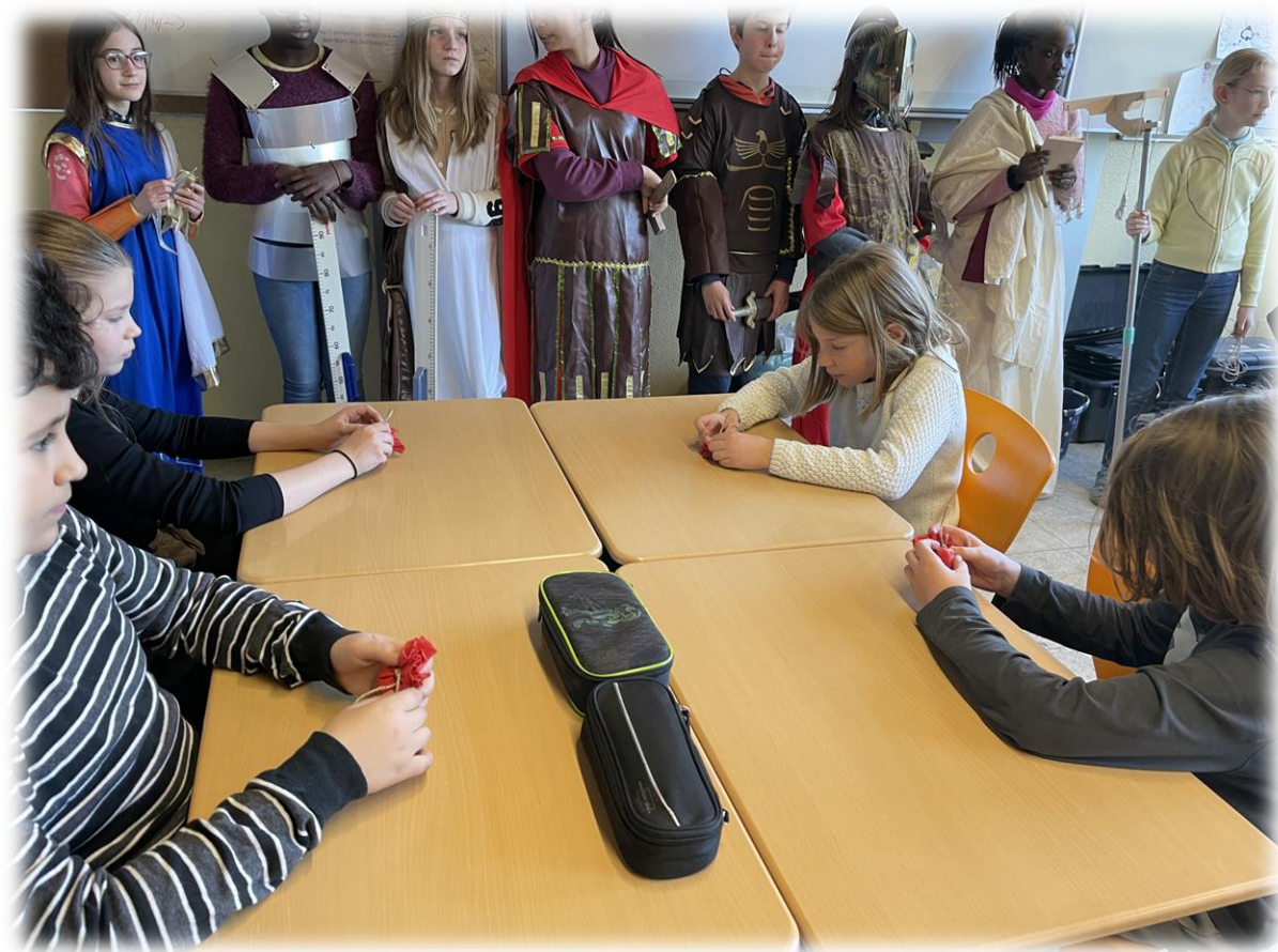
Les élèves du Challenge-programme dans la classe des élèves de P5 qui découvrent le jeu de la mola rotunda

La première médiation culturelle des élèves a eu lieu en mars 2023. Les élèves ont présenté leurs travaux aux nouveaux élèves lors des portes ouvertes de l'école européenne de Karlsruhe. Déguisés en légionnaires ou en déesses, portant la toge ou brandissant un casque spartiate digne du héros du jeu vidéo Assassins Creeds Odyssey , les élèves ont parcouru les couloirs de l'école afin de distribuer des flyers sur la venue des légionnaires à la Sommerfest et d'attirer les parents dans la salle du Challenge-programme Legio VIII. Avec mon collègue allemand, nous avons alors à cœur d'expliquer l'importance de choisir l'option latin en S2. Les couronnes de laurier que nous distribuions aux visiteurs permettaient d'en attirer d'autres.