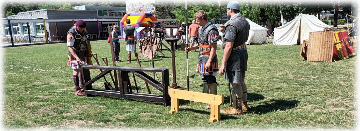
Petit et grand chorobates servant de niveau pour la construction des aqueducs.