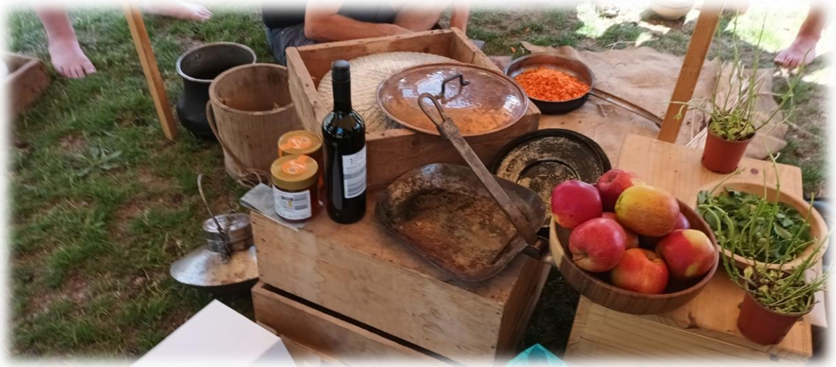
Sarcinae et repas de légionnaires