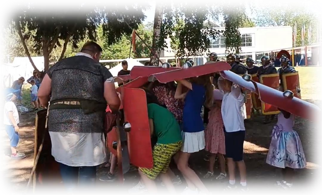
Formation en tortue.